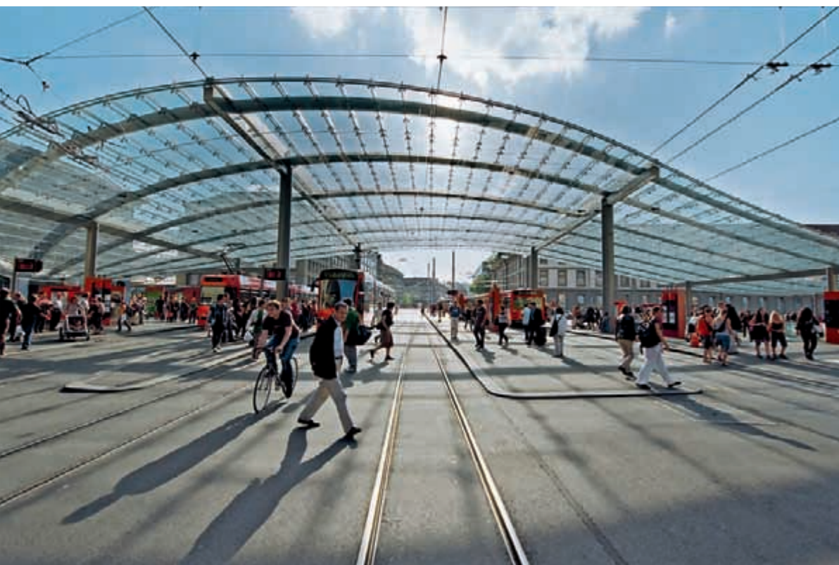
Der neue Bahnhofplatz